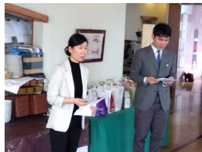
魏副総領事、万領事アタッチ